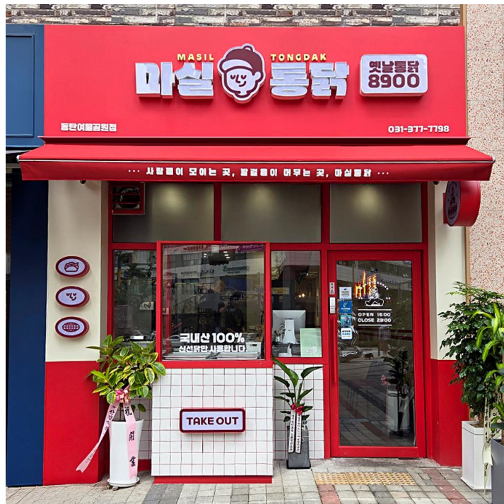
마실통닭 1호점 익스테리어, 내장마감 참고용