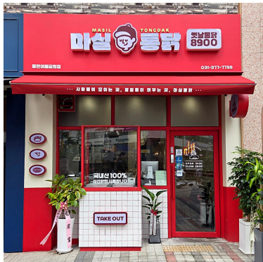
(참고용) 1호점 정면