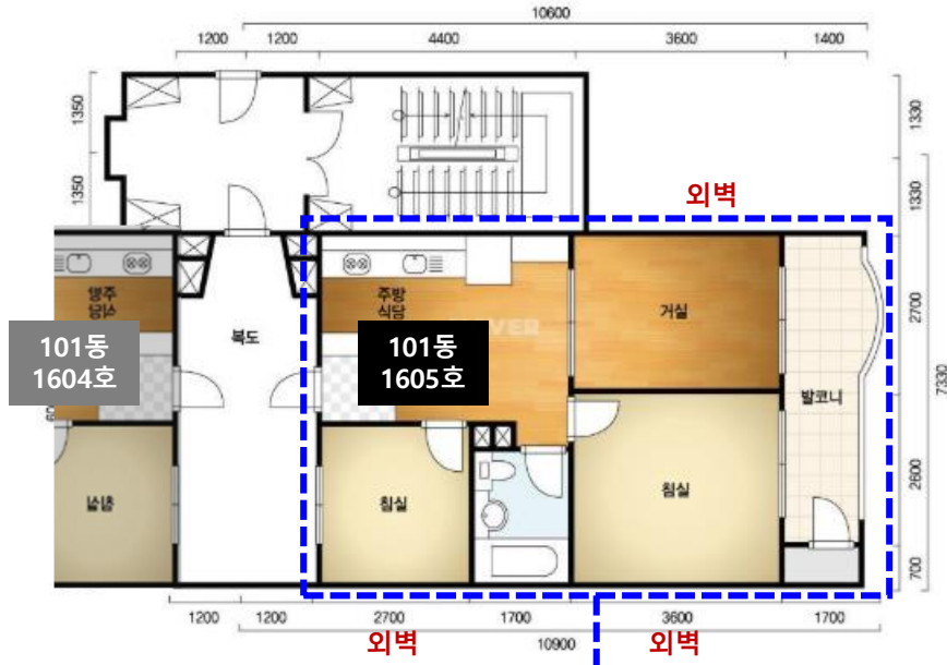
Archisketch 기준 도면